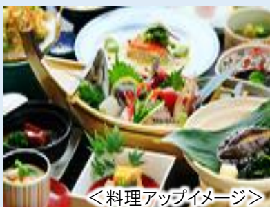
<料理アップイメージ>