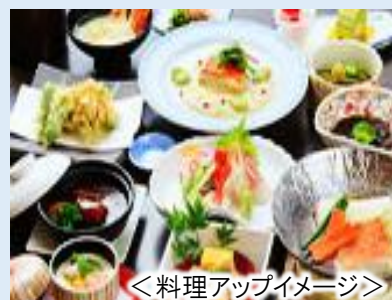
<料理アップイメージ>